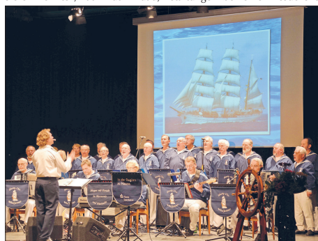
Auch mit dabei: Der Shantychor „Windjammer“

erster Vorsitzender des Gewerbe- und Fremdenverkehrsvereins von Schönberg. Dank der Flyer, die das Programm und die Uhrzeiten enthalten, könne sich jeder Besu-